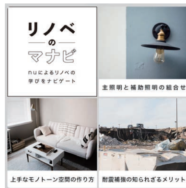
「リノベのマナビ」リッチメッセージ画像

リッチメッセージで配信する 4 つのコンテンツに対し、「リノベのマナビ」・「nu の新しい家できました」・「nu でしか読めないコト」・「今しか見れない特別な nu」など、クリックを促すキャッチーなタイトルコピー、画像の作成をいたしました。