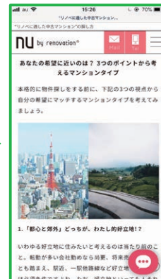
リンク先「HPウェブマガジン」